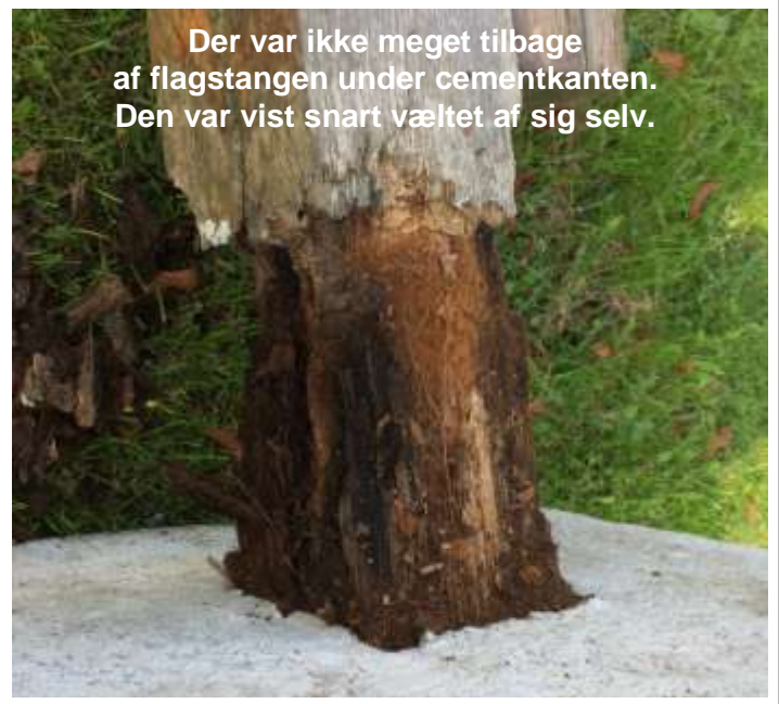
Der var ikke meget tilbage af flagstangen under cementkanten. Den var vist snart væltet af sig selv.