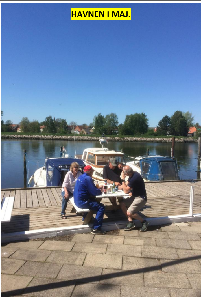
HAVNEN I MAJ.