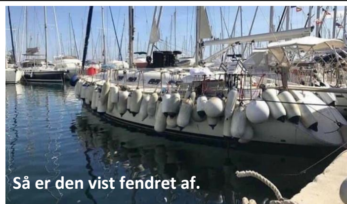
Så er den vist fendret af.

Så har vi en chance for at se hvad der kan fjernes når vi kommer til klubarbejdsdagen.